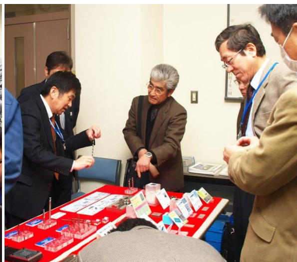
▲日立ツール株のサンプル展示