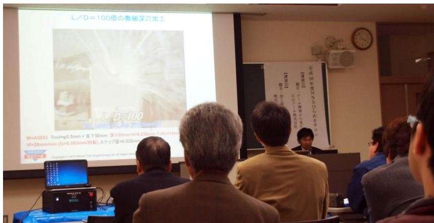
▲講演の様子（日立ツール）

NNSでは、ひらめきサロンとして、茨城工業高等専門学校（茨城高専）プロデュースによる産学連携フォーラムを開き、毎回テーマを絞って多彩な講師陣を招いて、知恵、アイデアを得る場を提供しています。